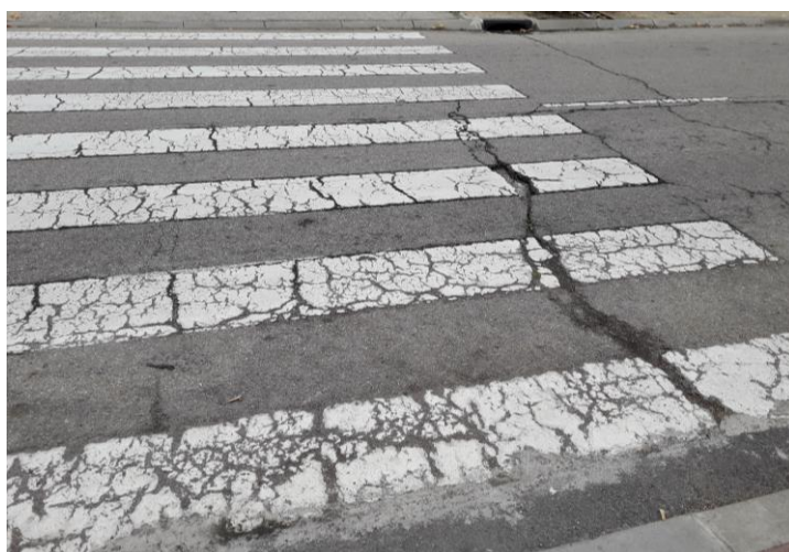
Fotografía nº 4. Paso de peatones en zona oeste.