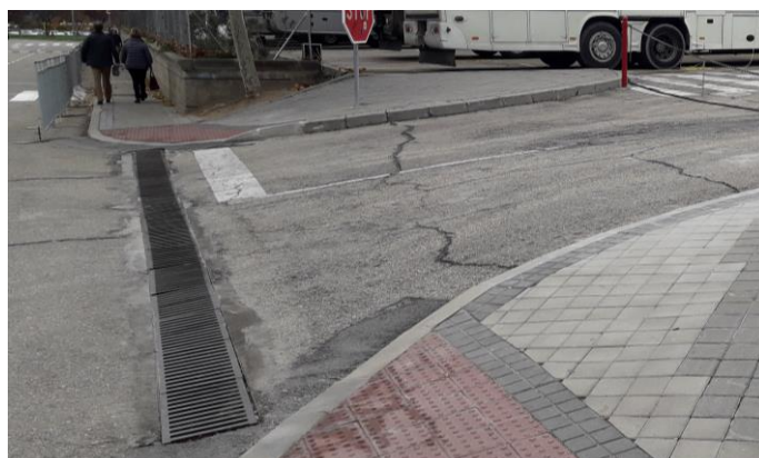
Fotografía nº 9. Acceso parking azul.