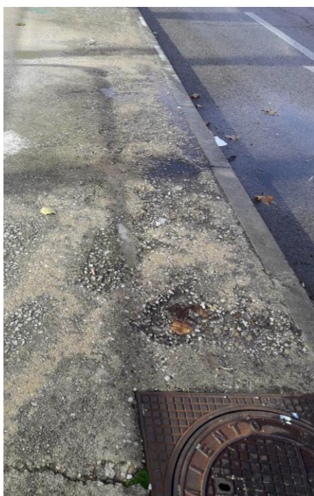
Fotografía nº 2. Acera localizada en zona sureste, frente a Pabellón 2.