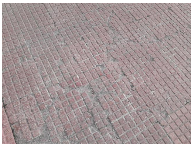
Fotografía nº 10. Acera zona Edificio Puerta Sur.

En el plano mostrado a continuación se encuentran sombreadas de manera aproximada las zonas generales de actuación, aunque durante el desarrollo del Proyecto será necesario estudiar en profundidad las necesidades reales del recinto y una vez consensuadas las necesidades y alcance con la D. Técnica de IFEMA, proceder al desarrollo del Proyecto.