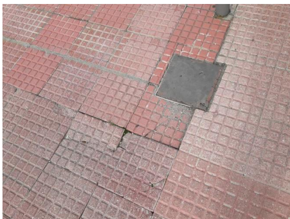
Fotografía nº 3. Acera en zona Edificio Puerta Sur.