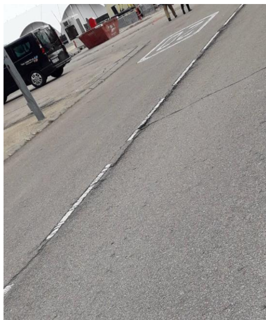
Fotografía nº8. Calzada con numerosos huecos en eje del vial.