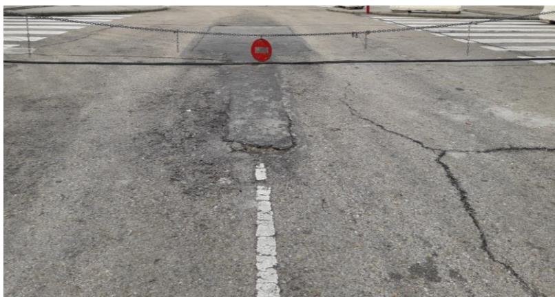
Fotografía nº 5. Acceso parking azul- blanco.