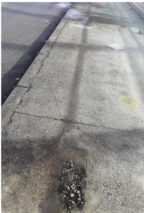
Fotografía nº 1. Acera localizada en zona sureste.