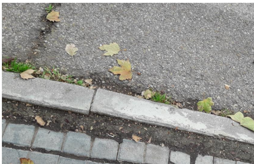
Fotografía nº 7. Acera frente a Pabellón 3.