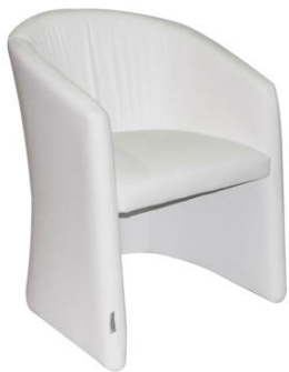
Sillón Árdenas blanco

Descripción: Sillón con asiento y respaldo en polipiel blanco. Medidas 68 x 66 x 78 cm.