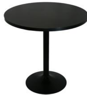
Mesa Zuchon negra

Descripción: Redonda de Ø 80 cm de estructura de hierro lacado blanco. 74 cm de alto.