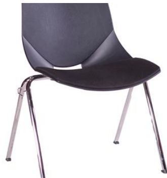
Silla Setter linkable

Descripción: Apilable, linkable, acolchada en respaldo y asiento. Estructura de tubo cromado