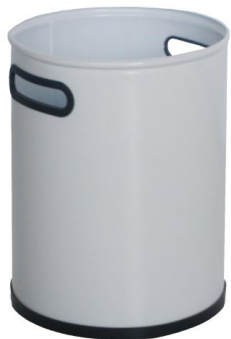
Papelerera Duero blanca

Descripción: Metálica de Ø 25 cm y 37 cm de alto, en color blanco.