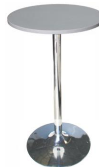
Mesa alta Annapurna

Descripción: Mesa alta de bar 110 cm de alto. Estructura cromada y formica gris.