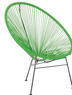
Silla Pomsky verde

Descripción: Ovalada, estructura de acero lacado negro. Asiento tranzado en PVC verde.