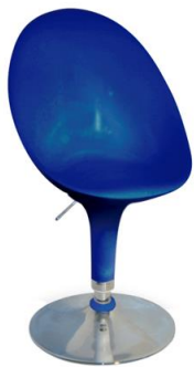
Silla Dogo azul

Descripción: Giratoria y regulable en altura. Estructura cromada. Asiento en ABS inyectado.