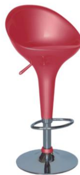
Taburete Génova rojo

Descripción: Taburete regulable con estructura cromada. Asiento en ABS rojo.