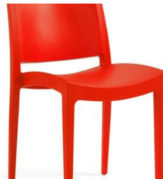
Silla Dinmont roja

Descripción: Estructura en polipropileno rojo de una pieza y sin brazos.