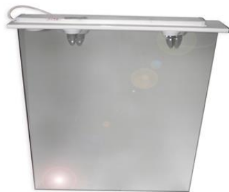
Espejo de pared

Descripción: Espejo de pared con dos luces incorporadas. Medidas: 60 x 15 x 100 cm.