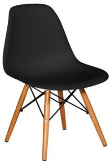
Silla Tulear negra

Descripción: Estructura de madera de haya y carcasa en polipropileno.