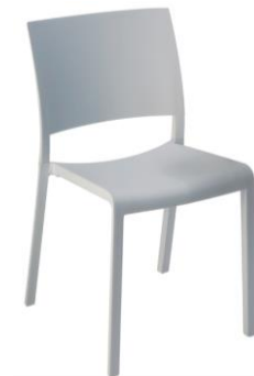
Silla Oslo blanca

Descripción: Silla apilable sin brazos, en polipropileno con fibra de vidrio blanco.