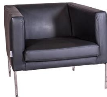
Butaca Collie negra

Descripción: Estructura de tubo de acero cromado. Tapizado en polipiel. 68 x 73 x 70 cm.