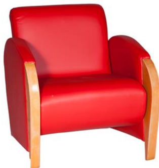
Butaca Corso roja

Descripción: Estructura de madera de pino. Asiento en polipiel. Medidas: 69 x 62 x 71 cm.