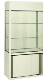
Vitrina Narva blanca

Descripción: Perfil de aluminio, tablero melaminado, armario bajo y luz. 100 x 50 x 198 cm.