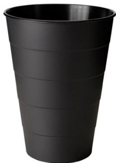
Papelerera Borzoi negra

Descripción: De plástico negra. Volumen de 10 L y 28 cm de alto.