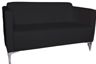
Sofá Cane negro

Descripción: De dos plazas, tapizado en polipiel. Patas de aluminio. Medidas: 71 x 118 x 88 cm.