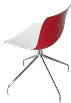
Silla Kangal B/R

Descripción: Giratoria, estructura de acero cromado. Asiento de polipropileno.