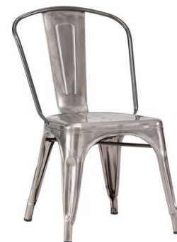
Silla Coton blanca

Descripción: Estructura de acero pintado en color acero inoxidable.