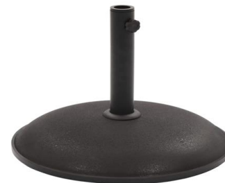
Base parasol Corgi

Descripción: Base de hormigón pintado en color negro. Peso 20 kg.