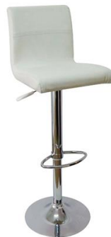
Taburete Presa blanco

Descripción: Regulable en altura. Columna y base cromada. Asiendo en polipiel blanca.