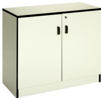
Armario Amur blanco

Descripción: Armario bajo con puerta, cerradura y estante interior. Medidas: 92 x 40 x 75 cm.