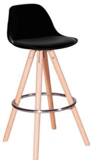
Taburete Chow negro

Descripción: Estructura en madera de pino. Asiento en ABS y cojín en polipiel negro.