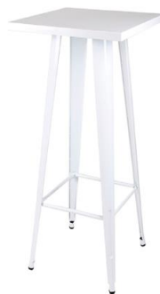
Mesa alta Mastín

Descripción: Blanca, cuadrada, fabricada en acero pintado blanco. Medidas: 60 x 60 x 105 cm.