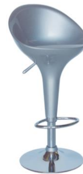
Taburete Génova gris

Descripción: Taburete regulable con estructura cromada. Asiento en ABS gris.