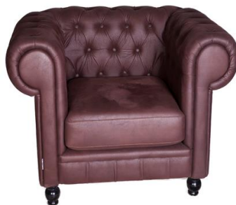
Sillón Akita marrón

Descripción: Chester, estructura de madera de roble tapizada en polipiel. 105 x 82 x 71 cm.