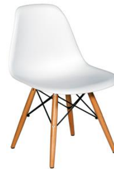
Silla Tulear blanca

Descripción: Estructura de madera de haya y carcasa en polipropileno.