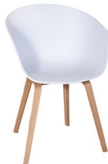
Silla Tosainu blanca

Descripción: Estructura en madera de nogal. Carcasa en polipropileno.