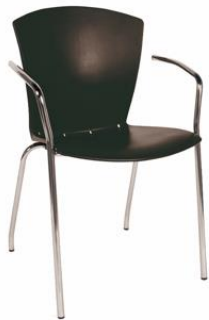
Silla Lobero negra

Descripción: Estructura en tubo de acero cromado. Carcasa de polipropileno negro.