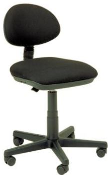
Silla giratoria Cádiz

Descripción: Silla giratoria con ruedas, regulable en altura. Asiento y respaldo tapizado negro.