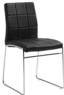
Silla Galgo negra

Descripción: Sillón confidente, estructura cromada y asiento en simil piel negra.