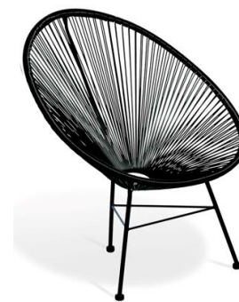
Silla Pomsky negra

Descripción: Ovalada, estructura de acero lacado negro. Asiento tranzado en PVC negra.