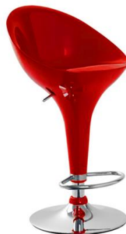
Taburete Grifon rojo

Descripción: Taburete regulable con estructura cromada. Asiento en ABS rojo.