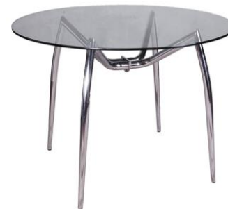
Mesa cristal Pinscher

Descripción: Redonda de Ø 120 cm de estructura de hierro cromado. 74 cm de alto.