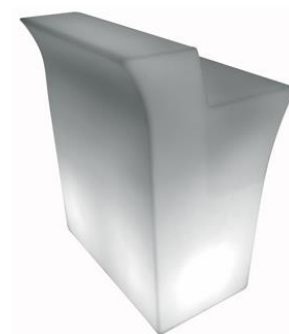
Barra de bar Berger

Descripción: Blanca, retroiluminada en polipropileno. Bombilla y cable. 80 x 90 x 110 cm.