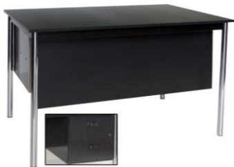
Mesa despacho Andes

Descripción: Mesa despacho 120 x 74 x 77, negro, dos cajones suspendidos y cerradura.