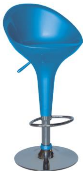
Taburete Génova azul

Descripción: Taburete regulable con estructura cromada. Asiento en ABS azul.