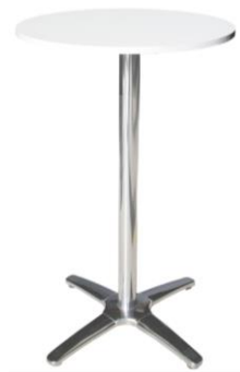
Mesa alta Vinson

Descripción: Mesa alta de bar 110 cm de alto. Armazón de acero y sobre de formica blanca.