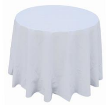
Mantel Lobero 183 cm.