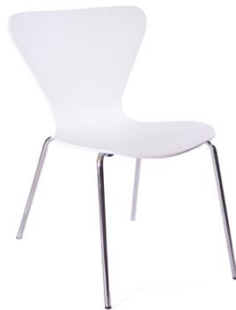
Silla Boerboel blanca

Descripción: Silla de madera tipo Jacobsen en color blanco.