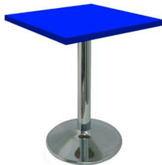
Mesa Carlino azul

Descripción: Cuadrada de estructura de tubo de hierro y plato cromado. 80 x 80 x 74 cm.