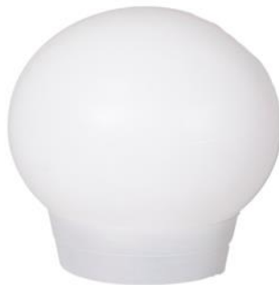
Lámpara esfera 40 cm.

Descripción: Lámpara globo, en polipropileno blanco de Ø 40 cm.