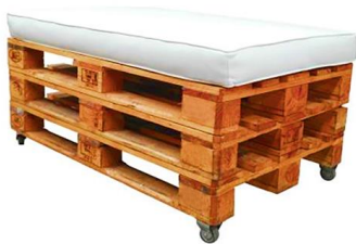
Banco Bull palets

Descripción: Con ruedas, estructura de palets y cojín en blanco. Medidas: 120 x 80 x 63 cm.