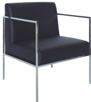
Sillón Grenoble negro