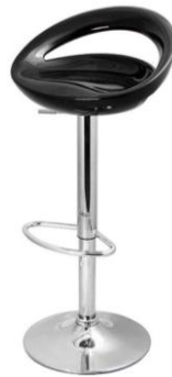
Taburete Siena negro

Descripción: Taburete regulable y, estructura cromada con asiento de ABS negro.