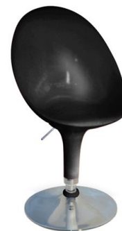
Silla Dogo negra

Descripción: Giratoria y regulable en altura. Estructura cromada. Asiento en ABS inyectado.