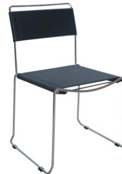
Silla Nueva York negra

Descripción: Silla apilable, estructura en polipiel negro con base de patín de varilla cromada.