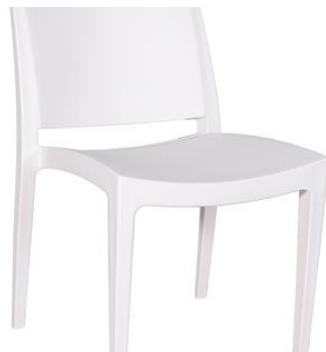
Silla Dandie blanca

Descripción: Estructura en polipropileno blanco de una pieza, sin brazos.