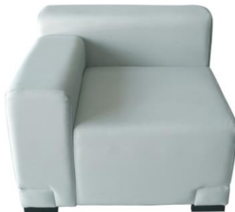
Sofá Norfolk izquierdo

Descripción: Esquina izquierda. Asiento y respaldo en polipiel blanca. Medidas: 87 x 87 x 68 cm.