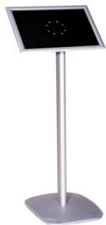
Punto información 120

Descripción: Pódium indicador, en aluminio color gris. Altura 120 cm.