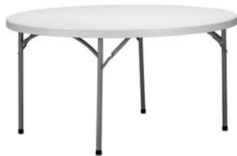
Mesa Husky catering

Descripción: Mesa redonda tipo catering de Ø 180 cm y 74 cm de altura.