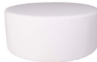
Puff Tolling blanco

Descripción: Redondo de Ø 120 cm. Estructura de madera, tapizado en polipiel blanco.