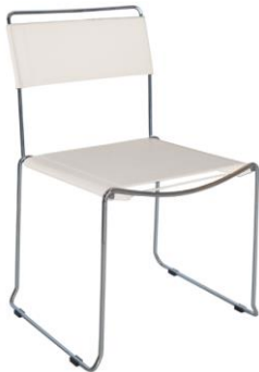
Silla Nueva York blanca

Descripción: Silla apilable, estructura en polipiel blanco con base de patín de varilla cromada.