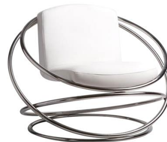
Sillón Maltés blanco

Descripción: Estructura de tubo en aros de acero inox. Asiento en polipiel. 65 x 76 x 73 cm.