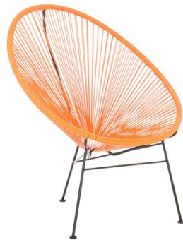
Silla Pomsky naranja

Descripción: Ovalada, estructura de acero lacado negro. Asiento tranzado en PVC naranja.