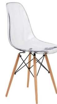
Silla Tulear transparent

Descripción: Estructura de madera de haya y carcasa en polipropileno.