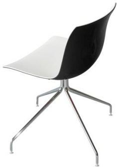
Silla Kangal B/N

Descripción: Giratoria, estructura de acero cromado. Asiento de polipropileno.