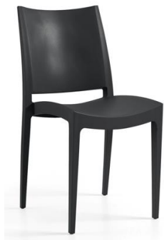
Silla Dinmont negra

Descripción: Estructura en polipropileno rojo de una pieza y sin brazos.