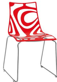
Silla Jagd roja

Descripción: Estructura de policarbonato y estructura de varillas de acero cromado.