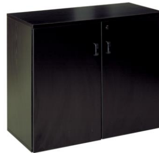
Armario Amur negro

Descripción: Armario bajo con puerta, cerradura y estante interior. Medidas: 92 x 40 x 75 cm.