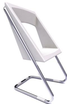
Silla Basenji blanca

Descripción: Roja. Asiento en poliuretano y estructura en tubo de acero cromado Modelo: SI82