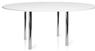
Mesa Airedale ovalada

Descripción: Ovalada de estructura metálica y sobre en melamina. 100 x 200 x 74 cm.