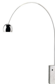
Lámpara de pie Bretón

Descripción: Base de mármol blanco, pie telescópico en acero inoxidable. Altura 220 cm.