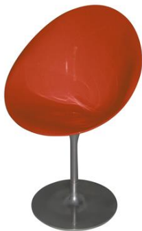
Silla Palleiro roja

Descripción: Giratoria. Estructura cromada. Asiento ovalado de policarbonato rojo.