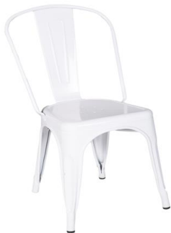
Silla Coton blanca

Descripción: Estructura de acero pintado en color blanco.