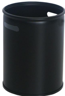
Papelerera Duero negra

Descripción: Metálica de Ø 25 cm y 37 cm de alto, en color negro.