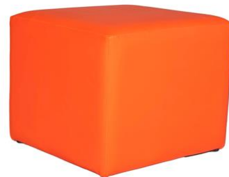
Puff Saluki naranja

Descripción: Estructura de madera, tapizada en polipiel de color naranja. 45 x 45 x 45 cm.