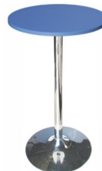
Mesa alta Annapurna

Descripción: Mesa alta de bar 110 cm de alto. Cromada y sobre de formica azul.