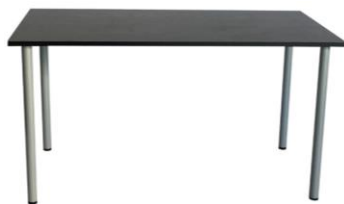
Mesa Lhotse negra

Descripción: Estructura tubo de acero y epoxi gris. Sobre de 140 x 80 x 72 cm en negro.