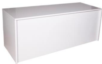
Mesa Braco blanca

Descripción: Mesa de conferencia de melamina blanca. Medidas 220 x 80 x 74 cm.