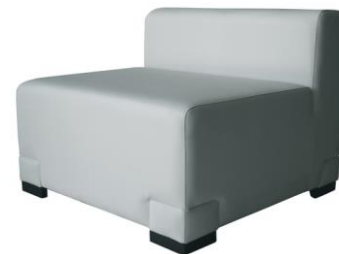
Sofá Norfolk central

Descripción: Centro de sofá. Asiento y respaldo en polipiel blanca. Medidas: 87 x 87 x 68 cm.