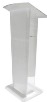
Atril de metacrilato

Descripción: De metacrilato transparente y parte frontal tipo hielo, con balda intermedia.