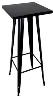
Mesa alta Mastín

Descripción: Negra, cuadrada, fabricada en acero pintado negro. Medidas: 60 x 60 x 105 cm.