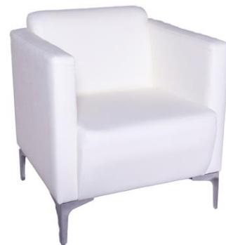
Butaca Cane blanca

Descripción: Estructura de madera. Completamente tapizado en polipiel. 71 x 66 x 88 cm.