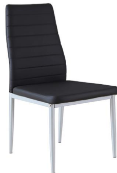
Silla Cairn gris

Descripción: Asiento en polipiel gris y estructura de acero lacado gris. 52 x 43 x 99 cm.