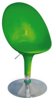
Silla Dogo verde

Descripción: Giratoria y regulable en altura. Estructura cromada. Asiento en ABS inyectado.