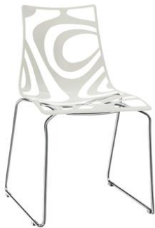
Silla Jagd blanca

Descripción: Estructura de policarbonato y estructura de varillas de acero cromado.