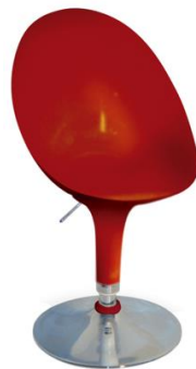
Silla Dogo roja

Descripción: Giratoria y regulable en altura. Estructura cromada. Asiento en ABS inyectado.