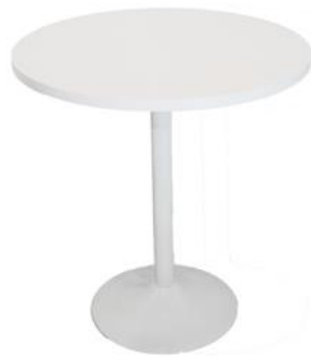
Mesa Zuchon blanca

Descripción: Redonda de Ø 80 cm de estructura de hierro lacado blanco. 74 cm de alto.