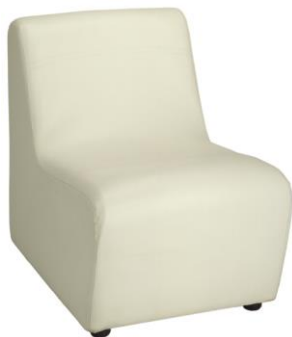
Sillón Santiago blanco

Descripción: Módulo sillón blanco. Acabado en polipiel. Medidas: 55 x 72 x 77 cm.