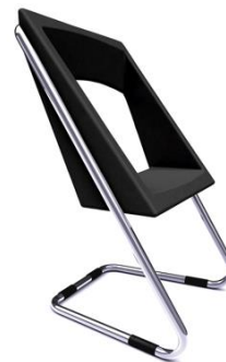
Silla Basenji negra

Descripción: Negra. Asiento en poliuretano y estructura en tubo de acero cromado.