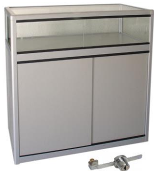
Mostrador Torne gris

Descripción: Vitrina, perfil de aluminio y melamina gris, puertas y balda. 100 x 50 x 100 cm.