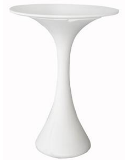
Mesa Cavachon blanca

Descripción: Estructura y sobre de poliuretano. Ø 70 cm