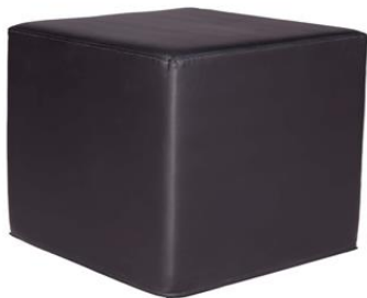
Puff Saluki negro

Descripción: Estructura de madera, tapizada en polipiel de color negro. 45 x 45 x 45 cm.