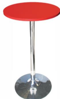
Mesa alta Annapurna

Descripción: Mesa alta de bar 110 cm de alto. Cromada y sobre de formica roja.