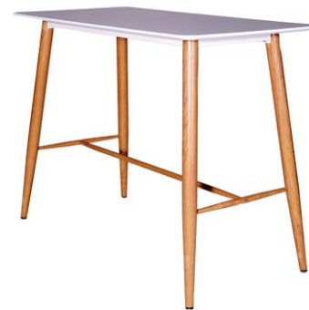
Mesa alta Bedlington

Descripción: Sobre de melamina blanca, estructura de acero acabado madera. 120 x 60 x 105 cm