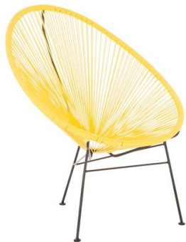
Silla Pomsky amarilla

Descripción: Ovalada, estructura de acero lacado negro. Asiento tranzado en PVC amarillo.