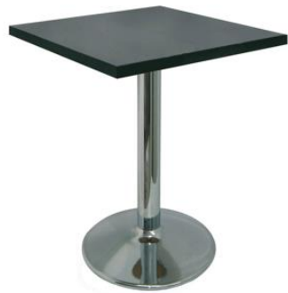
Mesa Carlino negra

Descripción: Cuadrada de estructura de tubo de hierro y plato cromado. 80 x 80 x 74 cm.