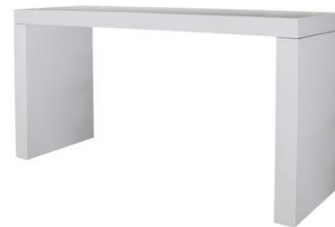
Mesa Kelpie blanca

Descripción: Mesa alta fabricada en DM, lacada en blanco. 120 cm de largo.