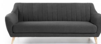
Sofá Terranova gris

Descripción: Estructura de madera, tapizada en tela y patas de madera. 81 x 190 x 82 cm.