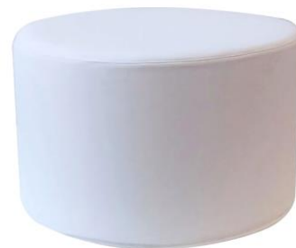
Puff Tolling blanco

Descripción: Redondo de Ø 75 cm. Estructura de madera, tapizado en polipiel blanco.