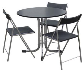
Conjunto de Mobiliario 3

Descripción: Mesa redonda de Ø 80 cm. y altura de 74 cm. Sobre en melamina de 19 mm en negro. 3 sillas plegables. Asiento y respaldo en polipropileno negro.