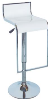
Taburete Milán blanco

Descripción: Taburete regulable en altura y cromada. Asiento en ABS blanco.