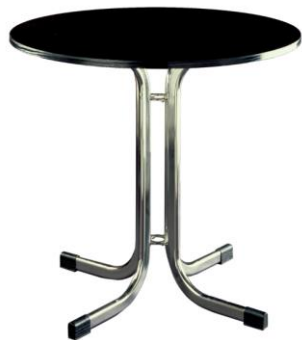
Mesa Katyn negra

Descripción: Mesa redonda de 74 cm. de altura y sobre Ø 90 cm. en color negro.