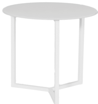
Mesa Yorkie blanca

Descripción: Redonda de Ø 60 cm de estructura de hierro en blanco. 50 cm de alto.