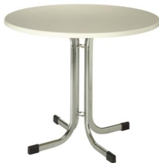
Mesa Katyn blanca

Descripción: Mesa redonda de 74 cm. de altura y sobre Ø 90 cm. En color blanco.