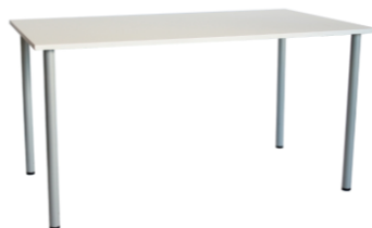
Mesa Makalu blanca

Descripción: Estructura tubo de acero y epoxi gris. Sobre de 120 x 80 x 72 cm en blanco.