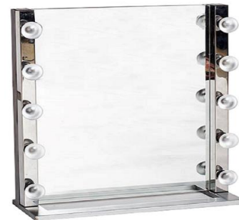
Espejo de maquillaje

Descripción: Espejo con luz (10 bombillas) y repisa de madera. Medidas: 60 x 25 x 75 cm.