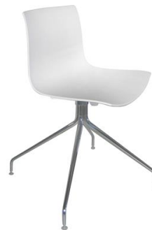
Silla Kangal blanca

Descripción: Giratoria, estructura de acero cromado. Asiento de polipropileno.