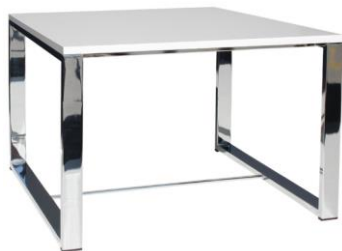
Mesa Kibo blanca

Descripción: Mesa baja de 40 cm de altura con pie de tubo de acero rectangular cromado. Sobre de 60 x 50 cm en color blanco.