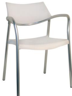
Silla Bobtail blanca

Descripción: Estructura de aluminio y asiento de polipropileno blanco con brazos.