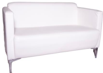
Sofá Cane blanco

Descripción: De dos plazas, tapizado en polipiel. Patas de aluminio. Medidas: 71 x 118 x 88 cm.