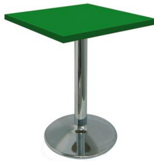
Mesa Carlino verde

Descripción: Cuadrada de estructura de tubo de hierro y plato cromado. 80 x 80 x 74 cm.