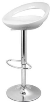
Taburete Siena blanco

Descripción: Taburete regulable, estructura cromada con asiento de ABS blanco.