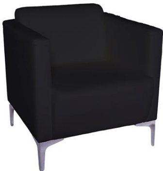
Butaca Cane negra

Descripción: Estructura de madera. Completamente tapizado en polipiel. 71 x 66 x 88 cm.