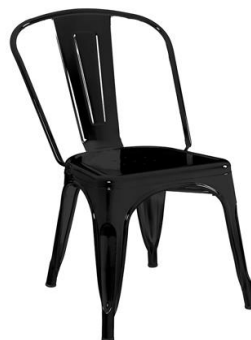
Silla Coton blanca

Descripción: Estructura de acero pintado en color negro.