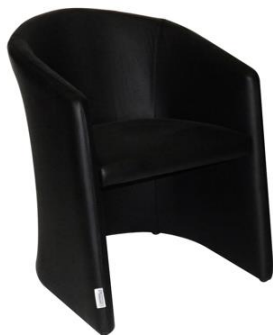
Sillón Árdenas negro

Descripción: Sillón con asiento y respaldo en polipiel negro. Medidas 68 x 66 x 78 cm.