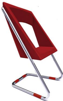
Silla Basenji roja

Descripción: Roja. Asiento en poliuretano y estructura en tubo de acero cromado Modelo: SI82