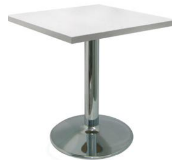
Mesa Carlino blanca

Descripción: Cuadrada de estructura de tubo de hierro y plato cromado. 80 x 80 x 74 cm.