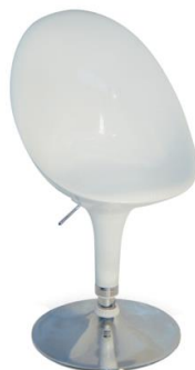
Silla Dogo blanca

Descripción: Giratoria y regulable en altura. Estructura cromada. Asiento en ABS inyectado.