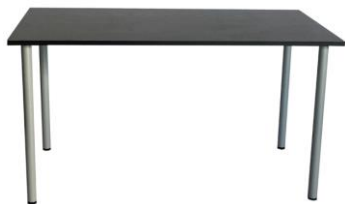
Mesa Makalu negra

Descripción: Estructura tubo de acero en epoxi gris. Sobre de 120 x 80 x 72 cm en negro.