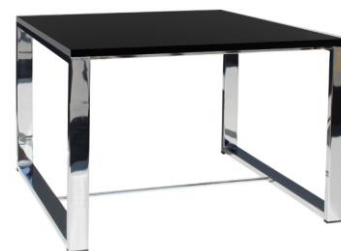
Mesa Kibo negra

Descripción: Mesa baja de 40 cm de altura con pie de tubo de acero rectangular cromado. Sobre de 60 x 50 cm en color negro.