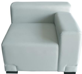
Sofá Norfolk derecho

Descripción: Esquina derecha. Asiento y respaldo en polipiel blanca. Medidas: 87 x 87 x 68 cm.