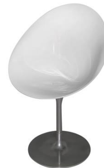
Silla Palleiro blanca

Descripción: Giratoria. Estructura cromada. Asiento ovalado de policarbonato blanco.