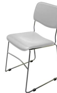
Silla Dálmata blanca

Descripción: Apilable. Estructura de varilla de acero cromado. Asiento en polipiel blanca.