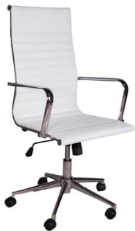
Sillón Skye blanco

Descripción: Respaldo alto, tapizado con polipiel. Estructura y brazos cromados. Pistón a gas.