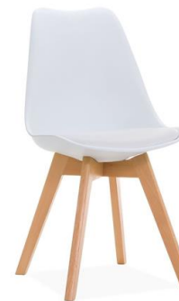
Silla Whippet blanca

Descripción: Estructura de madera de pino. Carcasa con cojín en polipiel.