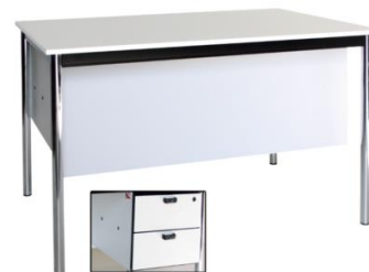
Mesa despacho Andes

Descripción: Mesa despacho 120 x 74 x 77, blanco, dos cajones suspendidos y cerradura.