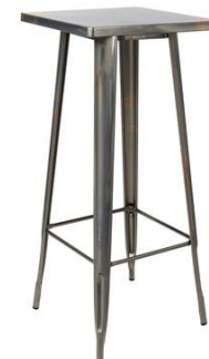
Mesa alta Mastín

Descripción: Inox, cuadrada, fabricada en acero pintado inox. Medidas: 60 x 60 x 105 cm.