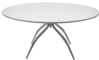
Mesa Shorkie blanca

Descripción: Redonda de Ø 150 cm de estructura de hierro cromado. 74 cm de alto.