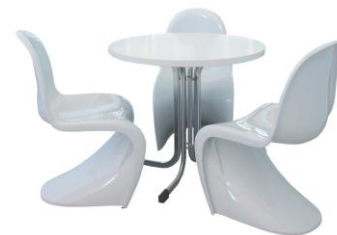
Conjunto de Mobiliario 2

Descripción: Mesa redonda den Ø 80 cm. Y altura 74 cm. Sobre de 30 mm. En blanco. 3 sillas fabricadas de una pieza de ABS inyectado en color blanco, sin brazos.