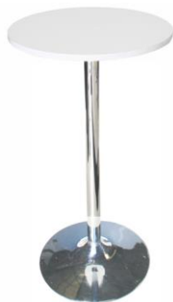
Mesa alta Annapurna

Descripción: Mesa alta de bar 110 cm de alto. Cromada y formica blanca.