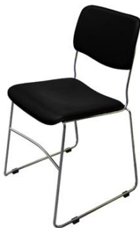
Silla Dálmata negra

Descripción: Apilable. Estructura de varilla de acero cromado. Asiento en polipiel negra.