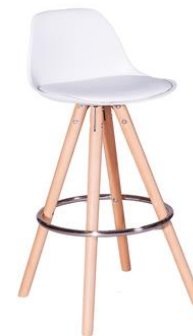
Taburete Chow blanco

Descripción: Negro. Poliuretano. Base de patín en acero cromado. 38,5 x 45 x 74/80 cm. Modelo: SI182