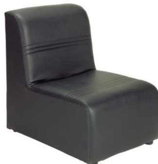
Sillón Santiago negro

Descripción: Módulo sillón negro. Acabado en polipiel. Medidas: 55 x 72 x 77 cm.