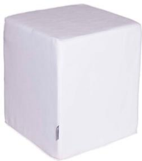
Puff Saluki blanco

Descripción: Estructura de madera, tapizada en polipiel de color blanco. 45 x 45 x 45 cm.