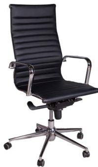
Sillón Skye negro

Descripción: Respaldo alto, tapizado con polipiel. Estructura y brazos cromados. Pistón a gas.