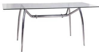
Mesa de cristal Pointer

Descripción: Rectangular de cristal, estructura de hierro cromado. 200 x 74 cm.