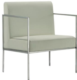
Sillón Grenoble blanco

Descripción: Sillón con brazos, estructura cromada y tapizado sintético blanco. 66 x 71 x 74 cm.