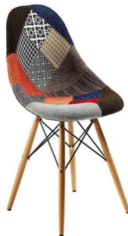
Silla Tulear patchwork

Descripción: Estructura de madera de haya y carcasa en polipropileno tapizada.