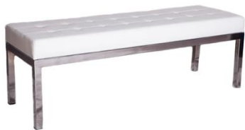
Banco Briquet blanco

Descripción: Asiento en polipiel blanco y estructura de tubo cromado. Medidas: 150 x 50 x 45 cm.