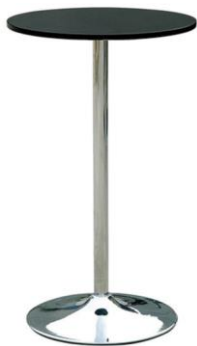
Mesa alta Campi

Descripción: Mesa alta de bar 110 cm de alto y Ø 60 cm negra y tubo redondo cromado.