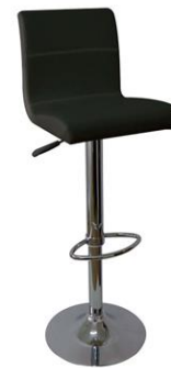
Taburete Presa negro

Descripción: Regulable en altura. Columna y base cromada. Asiendo en polipiel blanca.