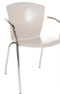
Silla Lobero blanca

Descripción: Blanca. Asiento en poliuretano y estructura en tubo de acero cromado. Modelo: SI83