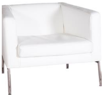
Butaca Collie blanca

Descripción: Estructura de tubo de acero cromado. Tapizado en polipiel. 68 x 73 x 70 cm.